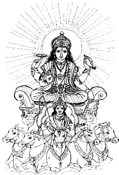
Imagen del Señor Surya, el Deva del Sol, en Su carro dorado con el que cruza los cielos.