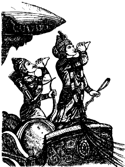
Sri Krishna y el Príncipe Arjuna, en su divino carro, en el momento previo al sagrado diálogo del Bhagavad Gîtâ